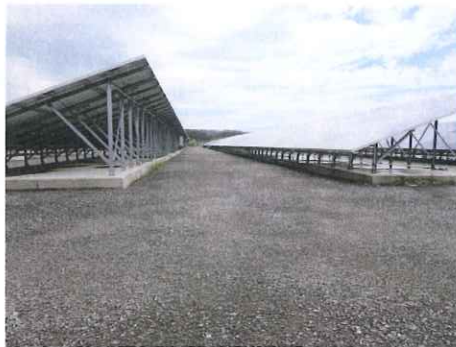
太陽光 2.5 メガ(1期2期合計) 鳥取県鳥取市気高町浜村 野里電気工業(株)/大阪