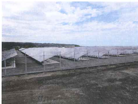
太陽光 3.5 メガ 徳島県海陽町 共栄ハウス(株)/大阪