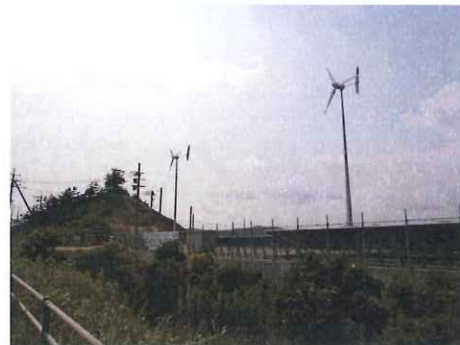
風力発電 鳥取県鳥取市気高町浜村